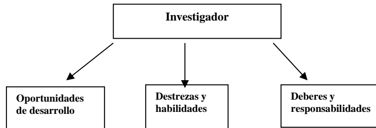
Figura 2. Investigador

La razón principal para seleccionar la categoría de Investigador es que, según surge del análisis, él es eje o actor principal dentro de una economía del conocimiento. Por lo que se debe evaluar cuál ha sido y cuál es el rol de éste en la sociedad y la economía puertorriqueña. En la actualidad, el investigador, así como cualquier otro trabajador del conocimiento, tiene una serie de retos que enfrentar y para esto debe enfocarse en aprovechar áreas de desarrollo y formación que lo conduzcan al mejor uso del conocimiento que se genera a través de su trabajo. Para