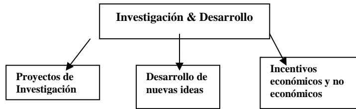
Figura 1. Investigación & Desarrollo

Ninguna de las categorías emergentes se consideró como categoría central, por lo tanto se buscó una categoría o frase que representara la idea central. La categoría seleccionada fue “Investigador”. Bajo la categoría de investigador se identificaron varias sub categorías o temas. Estas son: oportunidades de desarrollo y formación, rol en la sociedad y en la economía, deberes y responsabilidades de la carrera, uso y desarrollo del conocimiento. La figura 2 muestra el diagrama de esta categoría.